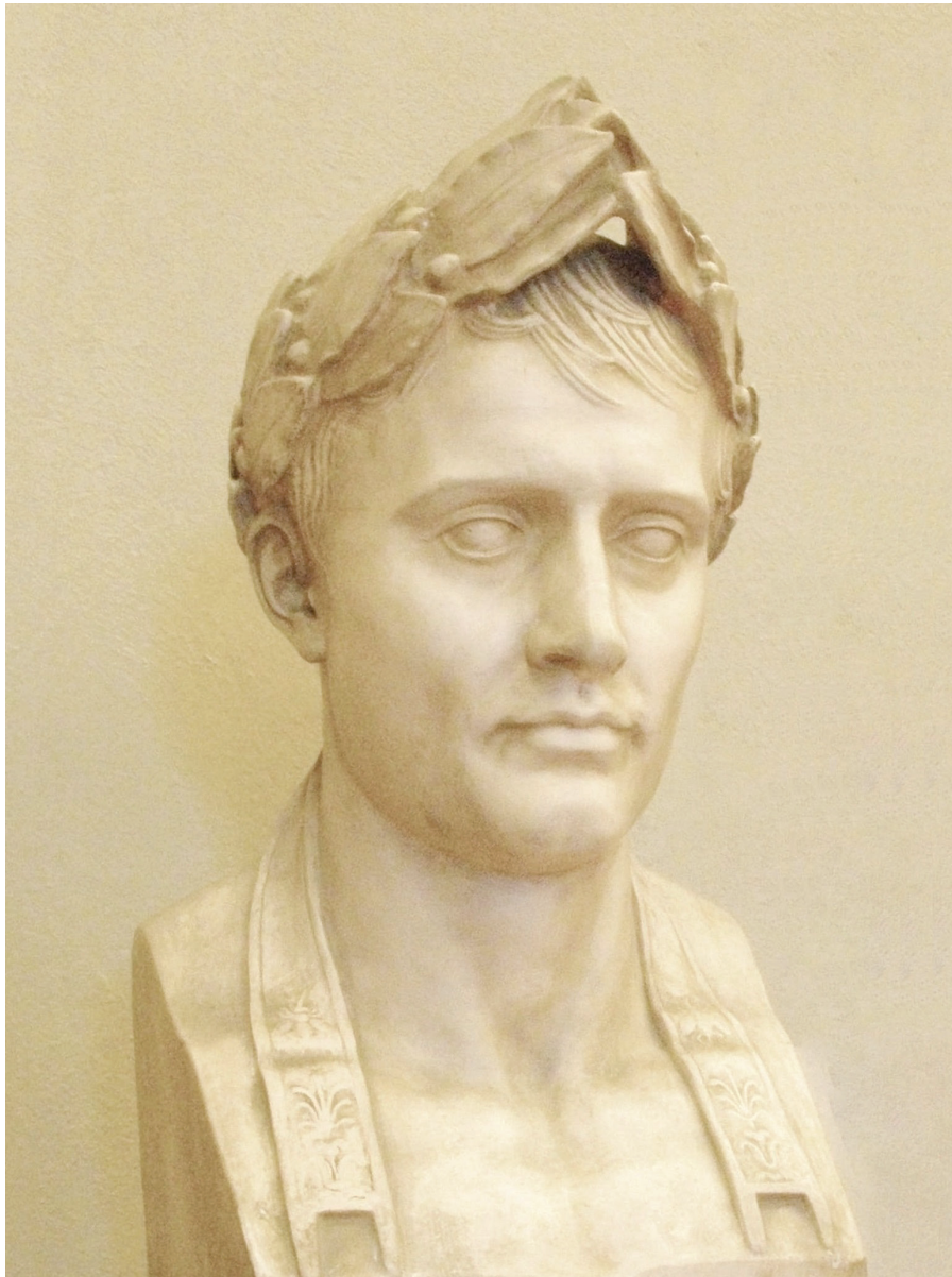
BUSTO DI NAPOLEONE BONAPARTE (Accademia della Crusca, Villa medicea di Castello)

L'opera, in terracotta, si rifà a una scultura di Antoine-Denis Chaudet (1763-1810) e reca sul retro la scritta "Manifattura di Signa P 634". Fu donata all'Accademia della Crusca nel 1915 da Camillo Bondi, fondatore e proprietario della Manifattura (vedi Archivio della Crusca, 382, Verballi 15, p. 752).